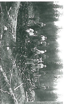
Att iordningställa tjårdalen var ett stort jobb som många kunde vara engagerade i.

Tjåran utvanns ur veden genom upphettning.